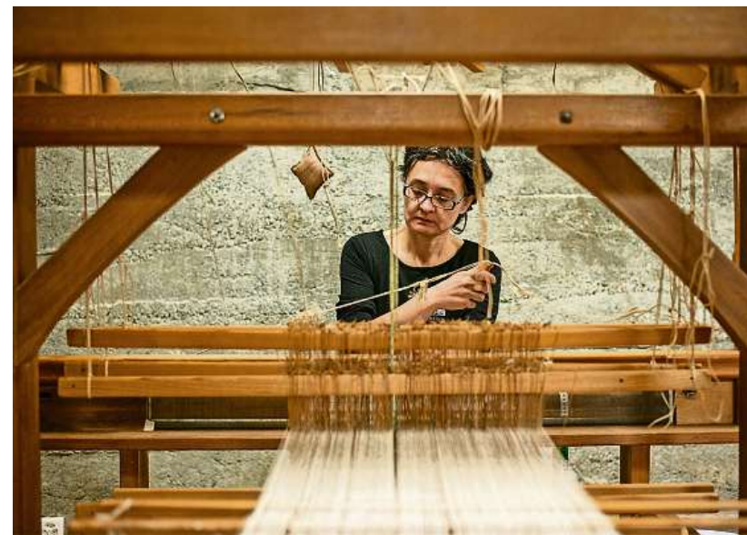
Handwerkskunst: Die Handweberinnen fertigen ihre Produkte auf traditionellen Webstühlen.